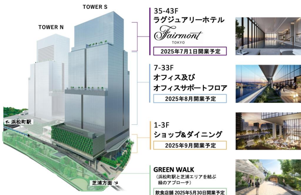
【図1】各施設の開業スケジュール

各施設の情報は下記、WEB サイトと SNS をご確認ください。今後、詳細な開業日や営業内容が確定次第、ニュースリリースや下記 WEB サイト等にて情報発信をまいります。