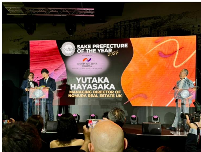
【7月9日 現地ロンドンでの表彰式の様子】