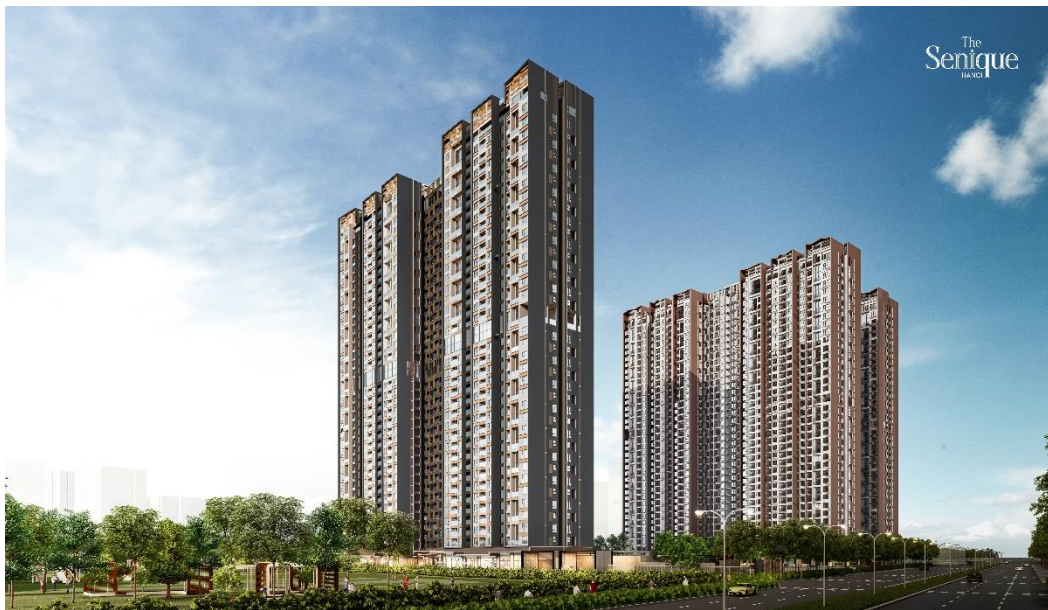
【The Senique Hanoi 外観イメージ】

当社にとって、ハノイ市アドレスでの事業展開は今回が初めてとなります。さらに、世界 40 カ国以上で不動産投資管理および不動産開発を展開する CapitaLand Group の開発部門、CapitaLand Development との協業も、当社として初の取組みとなります。