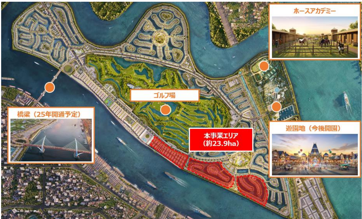
プロジェクト 地図・敷地完成配置図