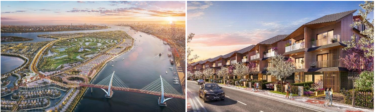
「Vu Yen プロジェクト (Royal Island)」完成予想パース

本事業は、約 23.9ha の中に 1,550 戸の住宅等を整備する大規模都市開発事業であり、連棟住宅（タウンハウス）の他、2戸連棟住宅（セミデタッチドヴィラ）、戸建住宅（ヴィラ）の開発を予定しています。野村不動産、JOIN、東神開発、大成建設がこれまで国内や海外で培ってきた住宅開発事業の知見を活かした商品企画や、施工品質管理を行うことにより、安心・安全かつ良質な住宅の整備・供給を行ってまいります。また、世界的に著名な建築家である隈研吾氏を起用し、川に囲まれた島というロケーションを活かし、「自然との調和」をテーマとした商品設計を行いました。