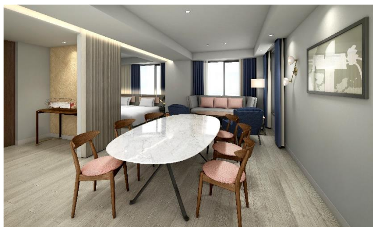
■スイート（リビングルーム）