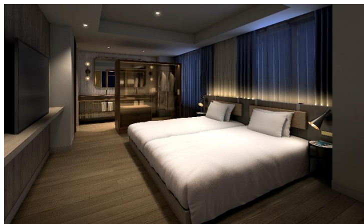
■スイート（ベッドルーム）