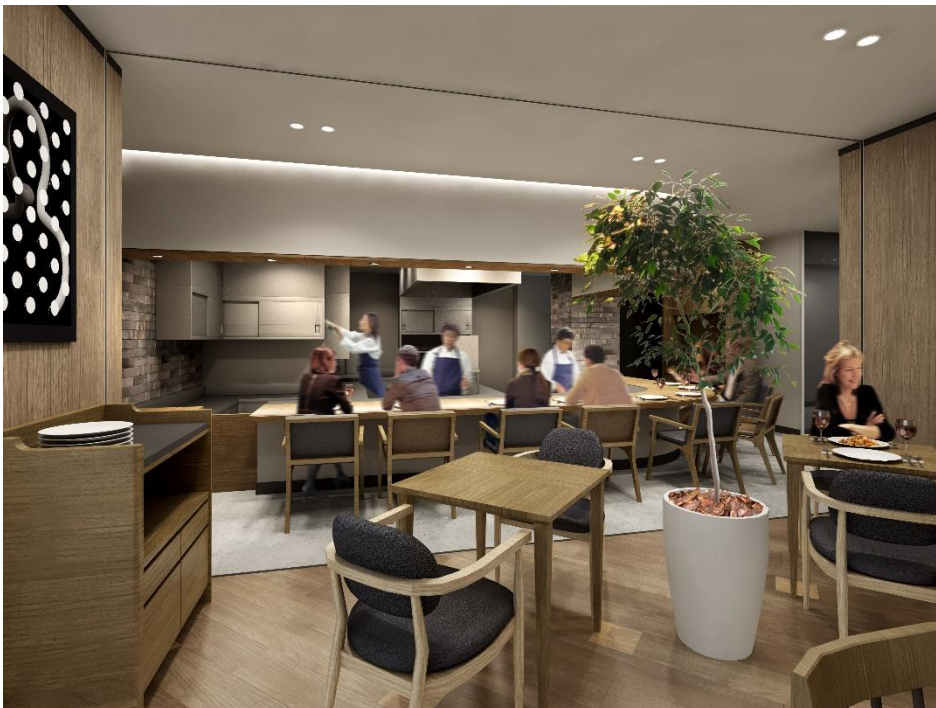
■レストランカウンター