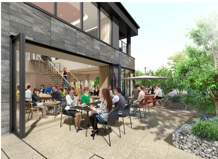
■ レストラン テラス席