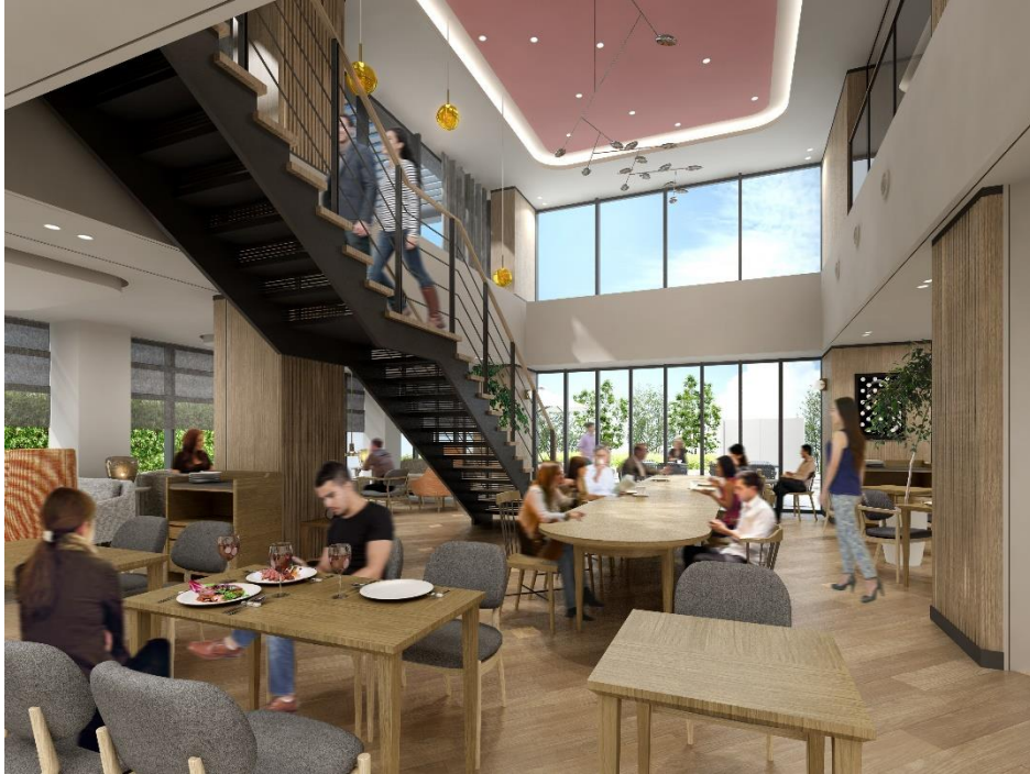
■レストラン・ラウンジ

「World meets Local and Natural Food & Drink」をコンセプトに、生産者の顔が見え、なるべく自然な製法で作られたこだわりのある食材を利用し、一日の活力につながるような食事・ドリンクをご用意いたします。食材の中には、地域のお店で取り扱うこだわりの食材も取り入れます。ドリンクも自然な製法で作られたナチュラルワイン・日本酒・クラフトビール・フレッシュジュースなどをご用意。食事と相性のよいドリンク、またドリンクとグラスのペアリングなどにもこだわり、お客様に驚きと感動をご提供します。