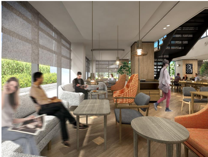
■ レストラン・ラウンジ

コンシェルジュカウンター付近のロビーにはギャラリーとショップを設け、地域のものを中心に日本各地から集めたアートやプロダクトを取り揃えます。アートは年に数回入れ替わりを予定しており、変化を楽しめる空間作りを目指します。スタッフ自らが発掘してきた地域の連携先をはじめとした魅力的でディープな情報を用意し、ゲストの方にローカルな体験を味わってもらえる提案をいたします。ロビーと連続する空間として、レストラン・ラウンジ・テラス席が広がり、宿泊者のみならずどなたでも気軽に利用することができます。レストラン・ラウンジには開放感のある吹抜けを設けており、直通階段で 2 階のラウンジ、テラス席もご利用いただけます。